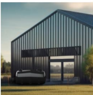
Esővízgyűjtés újrafelhasználás céljából