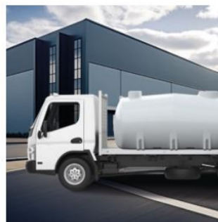
AdBlue® tárolása és kívánt helyre történő szállítása