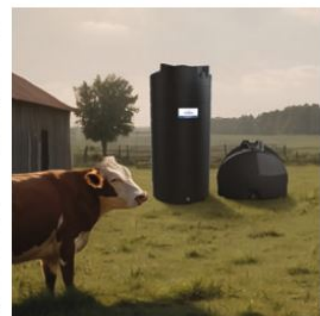
A tárolt víz felhasználása állatok itatására